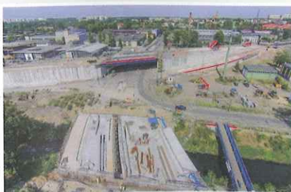
ul. Orlickiego, ul. Śliwki