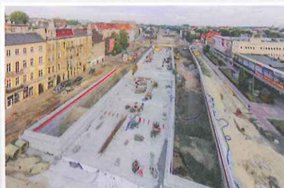
ul. Zwycięstwa, ul. Dworcowa